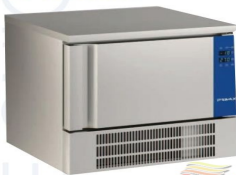
ABATIDOR Abatidor - Congelador BE-103L-HSO